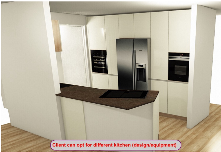
Client can opt for different kitchen (design/equipment)