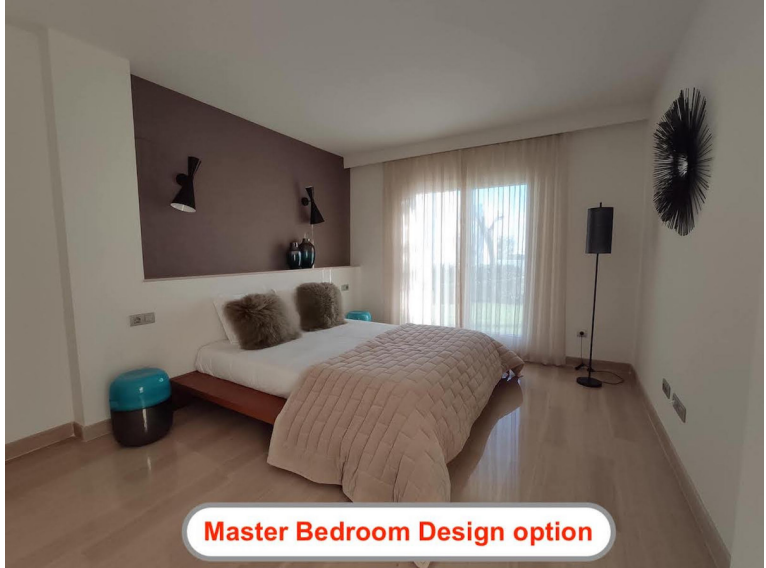
Master Bedroom Design option