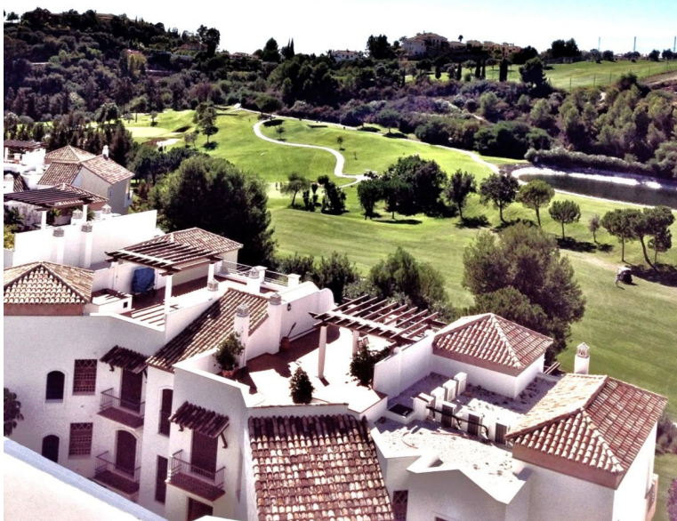
View of 2nd, 3rd & 4th fairway from terrace